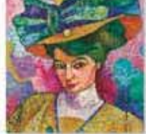
△ Jean METZINGER (1883-1956). «La mujer del sombrero», 1906. Óleo sobre lienzo. Esta pintura, encajada en formato vertical, es el retrato de una mujer elegante que mira con seguridad al espectador. La composición contiene una amplia variedad de colores.

El formato horizontal proporciona a la composición estabilidad, firmeza y solidez.